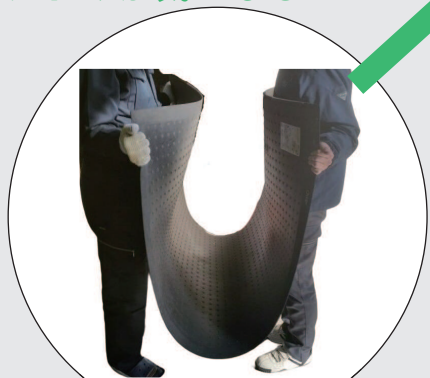
ワンツーマット 10t 使用