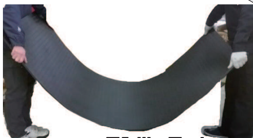
ワンツーマット ハードタイプ使用