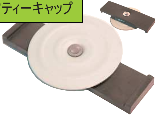
セフティーキャップ