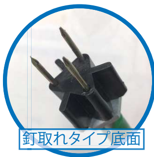
釘取れタイプ底面